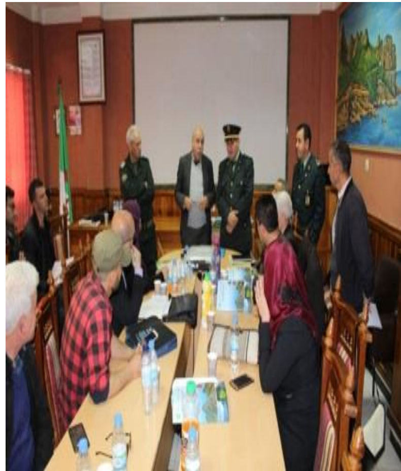
Signature d'une convention avec le LaMOS hier en marge du conseil d'Orientation du Parc National du Gouraya. Il s'agit de la première étape pour mettre en œuvre le projet de construction d'un cadran solaire