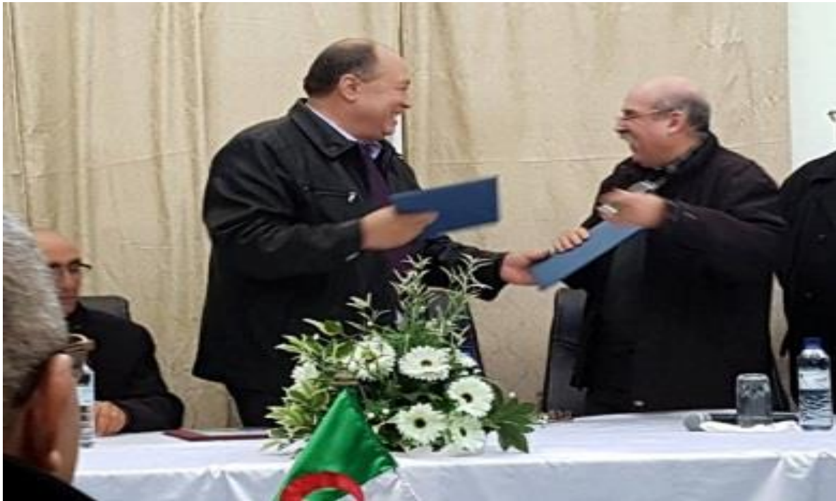
•Signature du protocole d'accord avec l'Agire essources en Eaux)