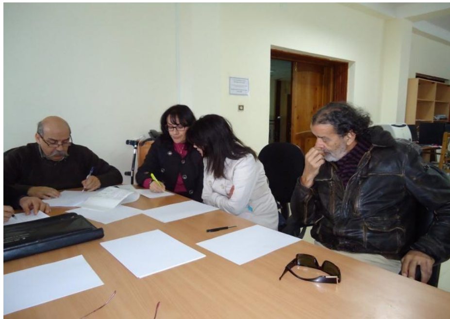
Convention LaMOS Béjaia – Barrage Béni Haroun (Mila) Photos: 2ème réunion du Comité d'Organisation (05/03/16 au LaMOS)