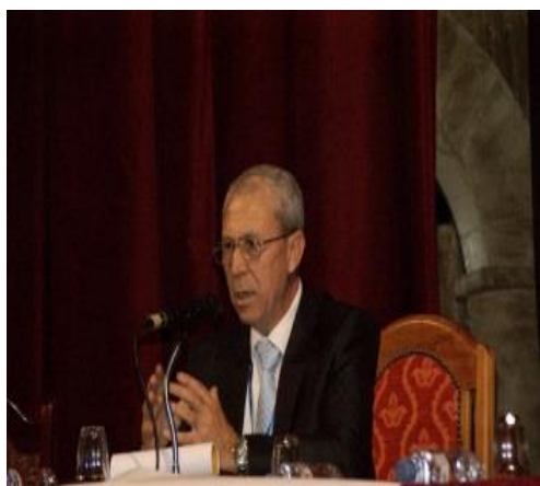
Convention avec le Colonel Bourouina, directeur Général du Centre National de Recherche sur l'Histoire des Stratégies Militaires, Riadh el Feth (au Ministère de la Défense Nationale )