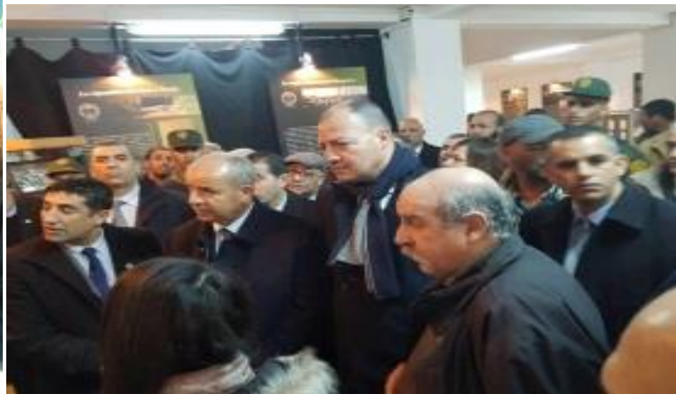
•Avec Mr Necib, ministre des ressources en Eaux